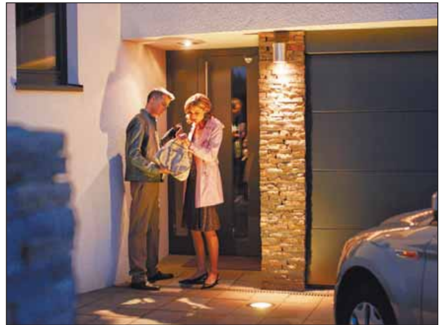
Der Außenbewegungsmelder bringt Licht ins Dunkel: Auf der Suche nach dem Schlüssel oder auf dem Weg vom Auto zur Haustür ist er ein willkommener Helfer.

Gerade in den Teilen des Hauses, die man nur selten aufsucht, ist es besonders ärgerlich, wenn man vergisst, das Licht wieder auszuschalten. Daher hat Hager den Innenbewegungsmelder entwickelt, der automatisch an- und wieder ausgeht, wenn er nicht mehr gebraucht wird – auch besonders praktisch für Kinder. Das spart zehn bis fünfzehn Prozent der Energie. Auch die im Programm befindlichen Außenbewegungsmelder leisten ihren Dienst und beleuchten dunkle Eingangsbereiche, Garagenzufahrten oder außen gelegene Kellerzugänge – sogar unter den widrigsten Wetterbedingungen. Im Gegensatz zu herkömmlichen Außen-